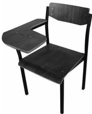
ภาพเก้าอี้นักเรียน