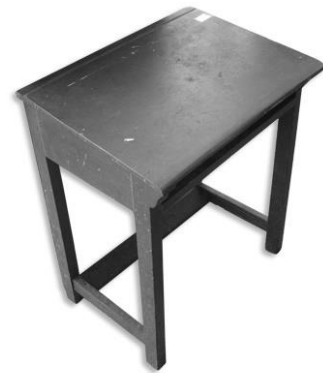
ภาพโต๊ะนักเรียน