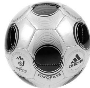
ภาพลูกบอล