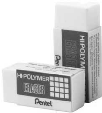
ภาพยางลบ