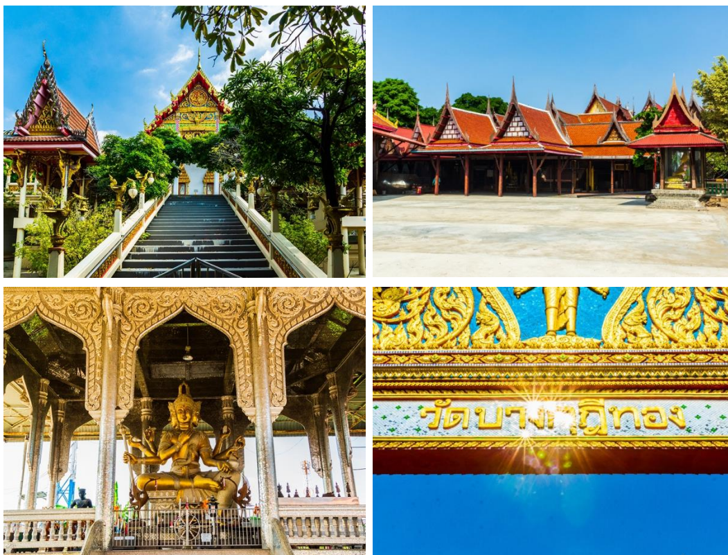
ภาพบริเวณวัดบางคูเด้อทอง จ.ปทุมธานี

อ้างอิง : edtguide , วัดบางคูเด้อทอง ปทุมธานี , (11 มิ.ย. 2551) เข้าถึงได้จาก